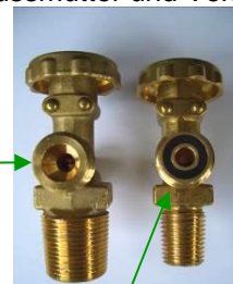
Absperrventil 5-, 11-kg-Flasche

Achtung: Unterschiedliches Dichtsystem der 5-, 11-kg-Flaschenventile (Dichtring im Entnahmestutzen des Flaschenventils) gegenüber 33-kg-Flaschenventilen (kein Dichtring, nur metallische Flachdichtfläche)